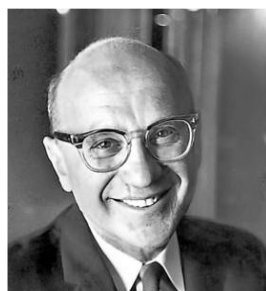
Milton Friedman Economista statunitense (1912-2006), Nobel nel '76, le sue teorie influenzarono la Thatcher e Reagan