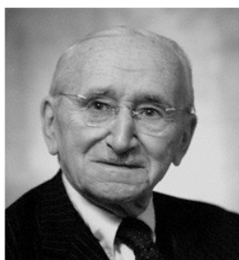
Friedrich von Hayek Esponente di rilievo della scuola economica austriaca, von Hayek (1899-1992) vinse il Nobel nel 1974