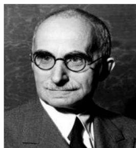
Luigi Einaudi Secondo Presidente della Repubblica italiana, Einaudi (1874 – 1961) fu un convinto sostenitore del liberalismo classico